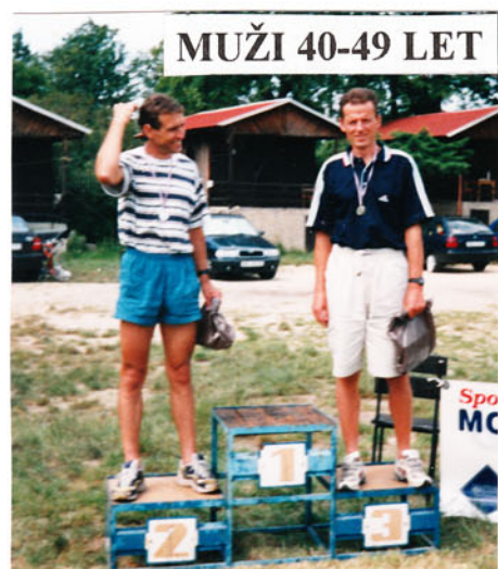
MUŽI 40-49 LET