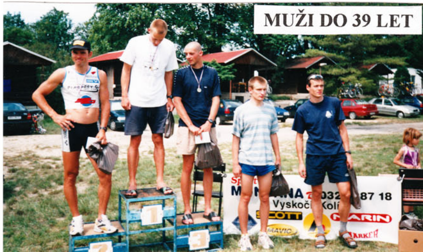
MUŽI DO 39 LET